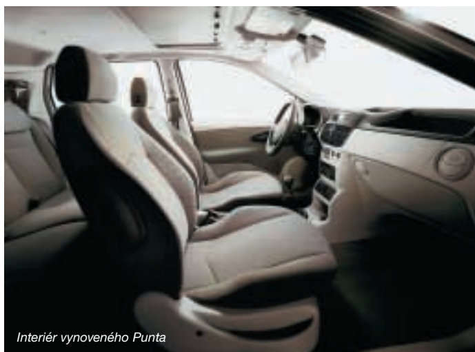
Interiér vynoveného Punta

spolujazdca, ktorý je možné deaktivovať v prípade, že by na prednom sedadle bolo prevážané dieťa v bezpečnostnej sedačke. ABD systém Bosch so štyrmi aktívnymi senzormi, štyrmi kanálmi a elektronickým rozdeľovačom brzdného účinku (EBD) je v štandarde u verzií Sporting a HGT, u ostatných verzií je na objednávku. Motory, ktoré sú k dispozícii pri novom modeli Fiat Punto sú: 1.2, 1.2 16v, 1.3 Multijet 16v, 1.4 16v, 1.8 16v a 1.9 JTD.