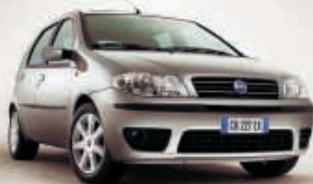
Čelo vozu je výrazne charakterizované originálnym usporiadaním svetiel s priehľadným krytom

ting). Elektronicky riadená robotizovaná prevodovka Dualogic v spojení s motorom 1.2 16v umožňuje dva spôsoby prevádzky: sekvenčnú s ručným ovládaním a automatickú s plynulým prechodom prevodov. Sekvenčný režim umožňuje meniť prevody bez toho, aby bolo nutné dať nohu z plynového pedálu. K dispozícii je 7 rýchlostí (Fiat Punto Sporting). Súčasťou štandardnej výbavy je airbag pre vodiča, na želanie je dodávaný aj airbag pre